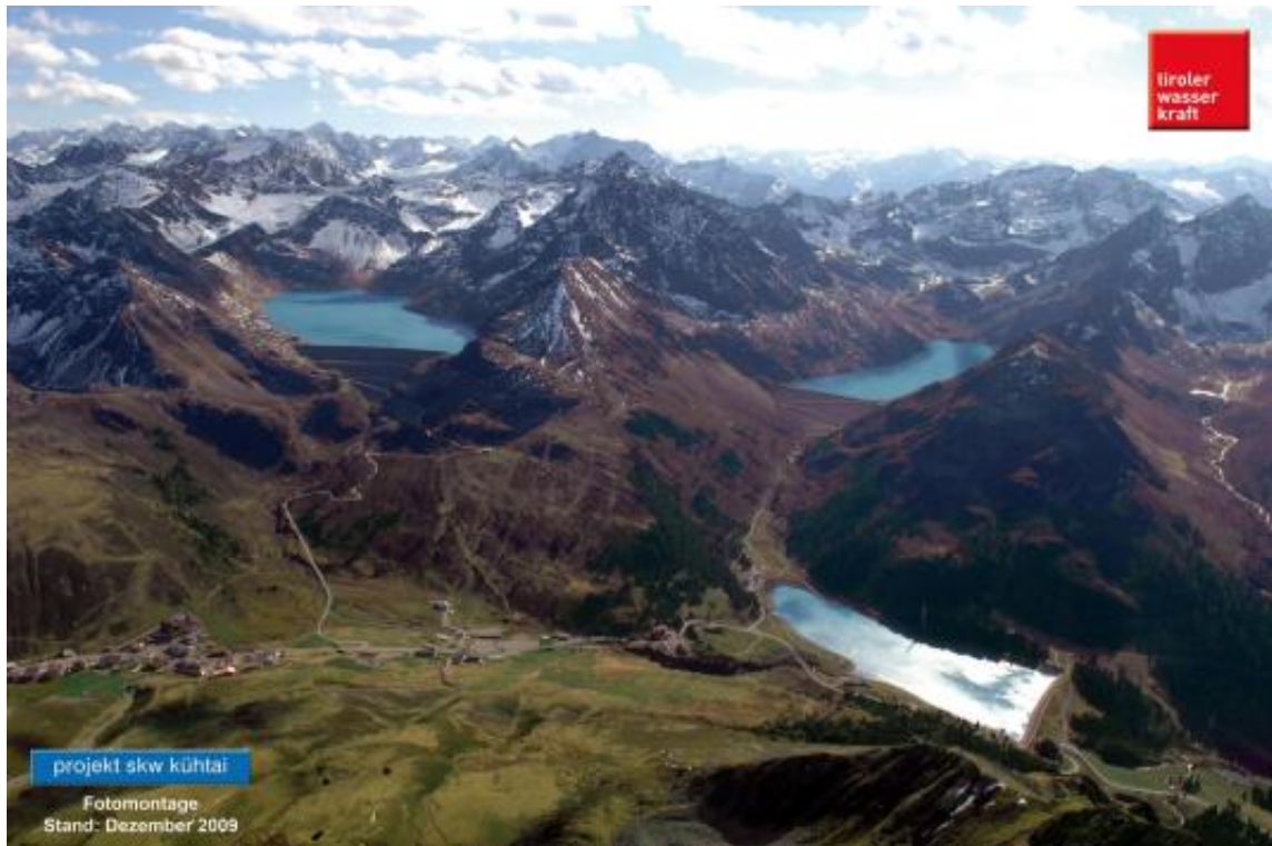
Geplanter Ausbau Kraftwerk Silz (Kühtai) [12]

zusichern [6]. In den entsprechenden Kreisen munkelt man bereits, dass dies die letzte neue Hochspannungsfreileitung in Österreich war.