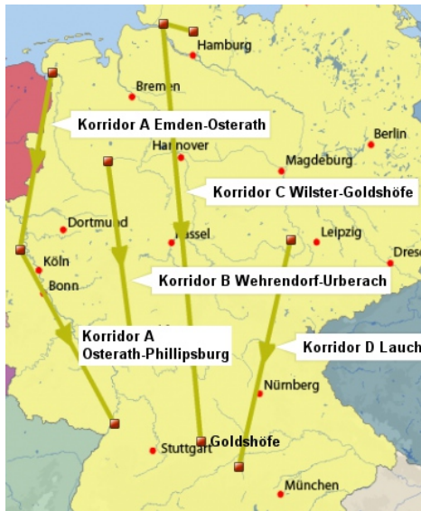
Geplante Stromtrassen [7]

Hierbei hat sich als bisher einzig ökonomisch sinnvolle Lösung die Speicherung der derzeit nicht benötigten Energie in Pumpspeicherkraftwerken herauskristallisiert. Und gerade bei diesem Punkt ist die Verlagerung der Energieerzeugung in den Norden problematisch, da Pumpspeicherkraftwerke in dieser Gegend nicht möglich sind. Alternativ bieten sich zum Beispiel bereits vorhandene und neue Standorte in den Alpen an, was aber wiederum bedeutet, dass die gesamte überzählige elektrische Energie zweimal quer durch Deutschland transportiert werden muss. Beispiele hierfür wären der derzeitige Ausbau des Kraftwerks Prutz in Tirol zu einem Pumpspeicherkraftwerk [13] beziehungsweise die Erweiterung des Kraftwerks Silz, ebenfalls in Tirol, um einen weiteren Speichersee [12]. Zum anderen sind auch die Fjorde an der skandinavischen Küste interessant, was wiederum einen