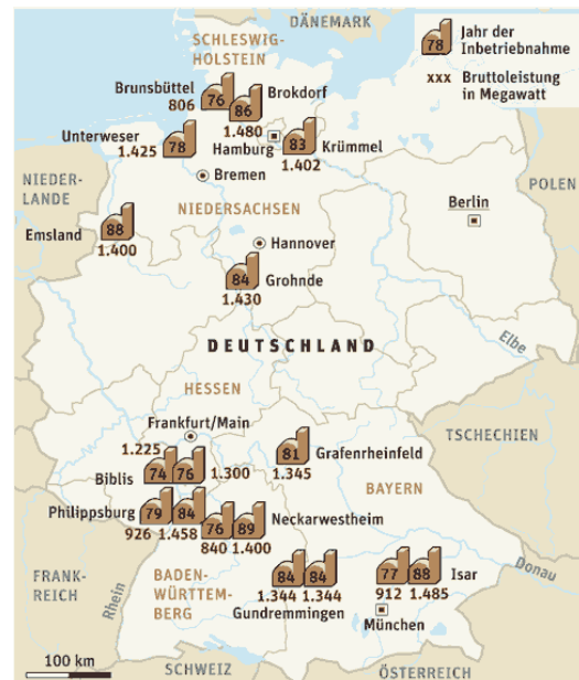
Atomkraftwerke in Deutschland [5]

Auf die Substitution durch alternative Energiequellen soll jedoch dieses mal nicht der Hauptaugenmerk gelegt werden. Dieser Punkt spielt im Sinne der Netzplanung nur dahingehend eine Rolle, als dass die Orte der Energieerzeugung und Nutzung beziehungsweise Entnahme aus dem Netz relevant sind. Hier zeichnet sich bereits heute eine klare Tendenz ab. In Zukunft wird die Energieversorgung viel stärker auf der Windenergie als heute basieren, was innerhalb Deutschlands eine Verlagerung der Erzeugung vor allem in den Norden, an die Küsten, bedeutet. Aus der Sicht der Netzbetreiber sehr kritisch, da ein großer Anteil der elektrischen Energie im Süden verbraucht wird. Es werden vor allem die südlicheren Bundesländer voraussichtlich massiv in den Ausbau von Solarkraftwerke investieren. Nur werden sie damit alleine von der installierten Leistung her vermutlich nicht einmal die heute dort in Betrieb befindlichen Atomkraftwerke ersetzen können. Zudem unterscheiden sich insbesondere Solarkraftwerke sehr stark von konventionellen Kraftwerken in Bezug auf die Versorgungssicherheit. Erstere können kaum bis gar nicht zur gesicherten Kraftwerksleistung gezählt werden. Das Problem der Verfügbarkeit der Leistung zeigt sich aber auch bei Windparks und wirft die Frage nach einer Speicherung auf.